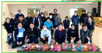
恒例の記念写真とXmasプレゼント

11月12月は体育館が使えず室内で体力維持メニューとして、ラジオ体操第1第2の後30分間ストレッチで体をほぐし、ポッチャを体験しました。