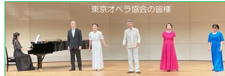
東京オペラ協会の皆様